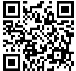
網路報名 QR Code