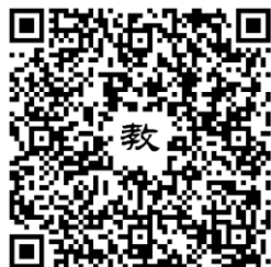
111 年活動教學模組指引連結

https://drive.google.com/file/d/1o9JGUfdYzQyv4L2Omy9GBTe4dA6D-CZE/view?usp=sharing