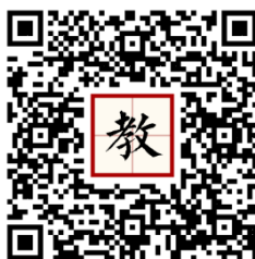
112 年活動教學模組指引連結