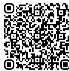
113 年活動教學模組指引連結